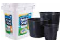
Buckets and ridged flower pots (no lids, no handles)