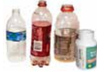
Bottles (8 oz. and larger)