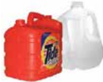
Jugs (milk, laundry, etc.)