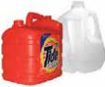
Recipientes de plástico (de leche, detergente líquido, etc.)