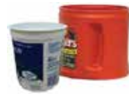
Tubs (dairy, coffee; no clear tubs)