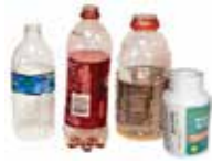
Botellas de plástico (de 8 onzas y más grandes)