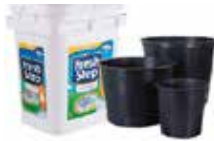
Contenedores de plástico en forma de cubo y contenedores de plástico para plantas (sin tapas, ni agarraderas)