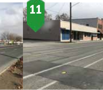
11. 2nd Avenue Pavement Restoration Maintenance seal Summer 2024