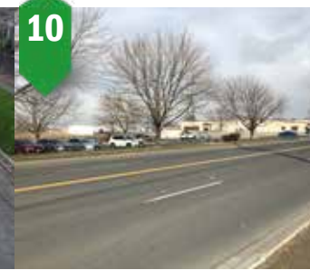
10. Rose Street Pavement Preservation Maintenance seal, traffic signal upgrades, new lane configuration Summer 2024