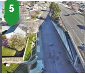
5. Cookerly IRRP Agua, alcantarillado, carreteras Primavera de 2023 a otoño de 2023