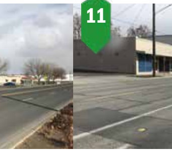
11. Revestimiento de mantenimiento en Avenida 2 Revestimiento de mantenimiento Verano de 2024