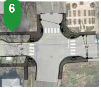
6. Mejoras para los peatones en Pioneer Park Mejoras de seguridad y accesibilidad Otoño de 2023