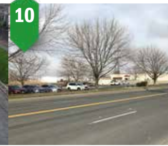
10. Mantenimiento de pavimentos en Calle Rose Revestimiento de mantenimiento, mejoras en las señales de tráfico, nueva configuración de carriles Verano de 2024