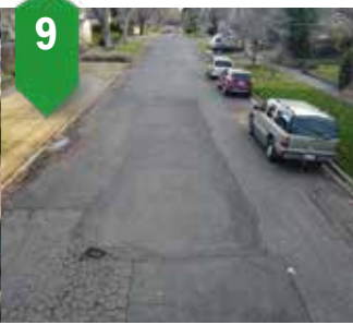
9. Hobson-Division-Madison Reemplazo de la línea de agua potable Primavera de 2024 a verano de 2024