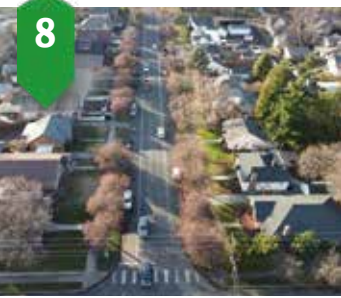
8. Chestnut - 2do a Howard IRRP Agua, alcantarillado, carreteras Verano de 2023 a verano de 2024