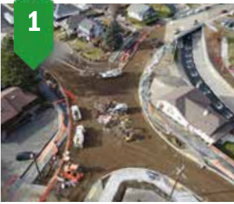
1. Alder/Poplar TBD Agua, alcantarillado, carreteras Verano de 2023