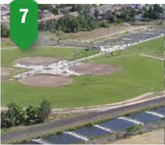
7. Mill Creek SportsPlex Improved parking, pickleball courts Summer-Fall 2023