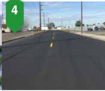
4. Mantenimiento de Pavimentos Recubrimiento de pavimento y sellado de grietas Varios lugares, verano de 2023