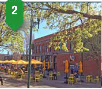
2. Walawála Plaza Asientos, sombra, fuentes de agua Verano de 2023