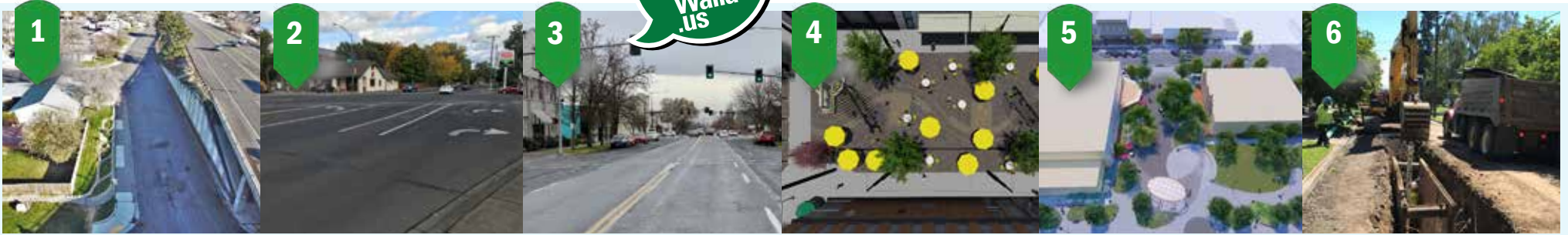
1 Cookerly IRRP Agua, alcantarillado, carreteras Primavera-Otoño de 2022