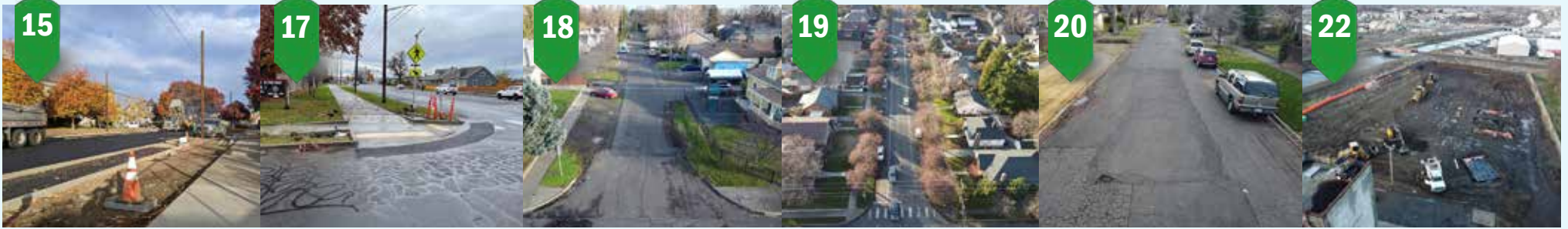
15 Park Street IRRP Agua, alcantarillado, carreteras Verano-Primavera de 2022