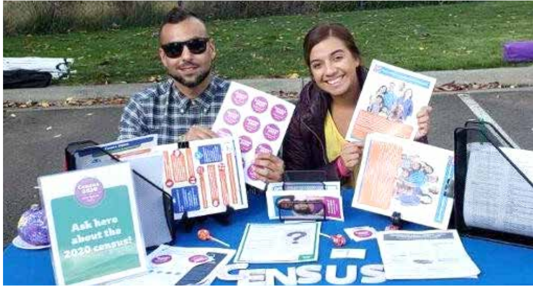
El Comité de conteo completo de Blue Mountain está llevando a cabo el Censo 2020 en nuestra área. Para más información, visite bmccc2020.org .

La Legislatura del Estado de Washington asigna aproximadamente $200 millones en fondos estatales