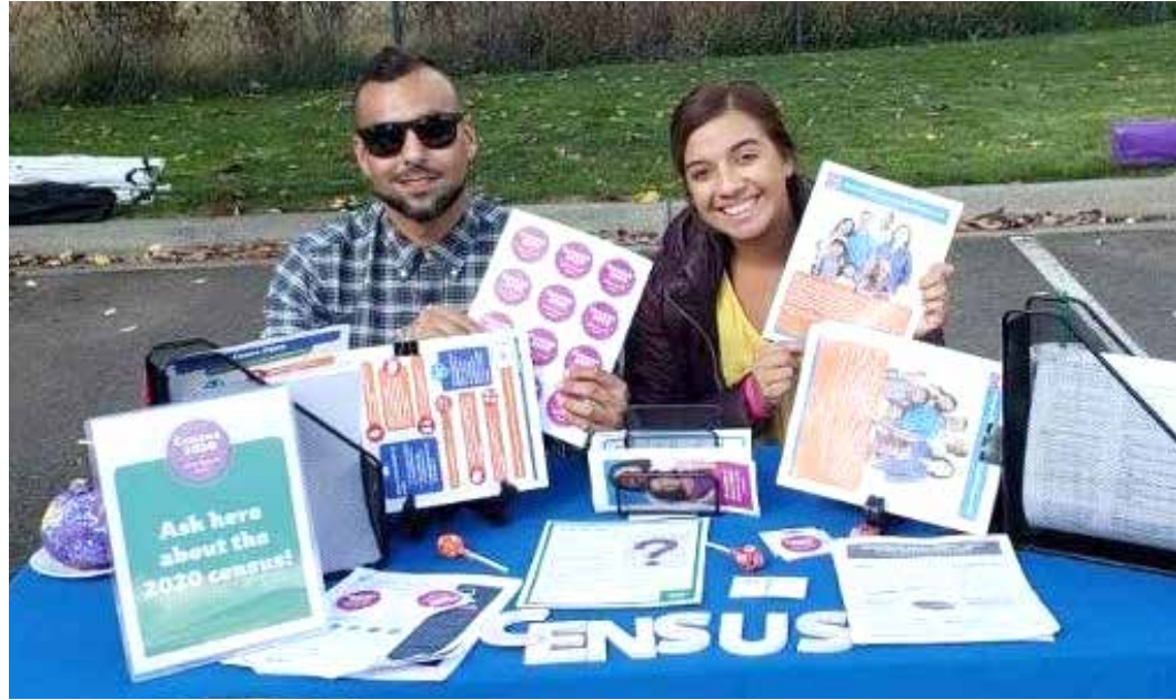
The Blue Mountain Complete Count Committee is conducting the 2020 Census in our area. For more information, visit bmccc2020.org .

The Washington State Legislature allocates approximately $200 million in state funds for programs